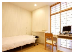
シャワー無し「洋室」