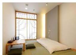
シャワー付き「和室」