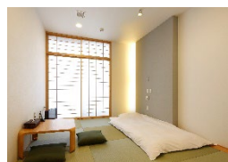
シャワー付き「和室」